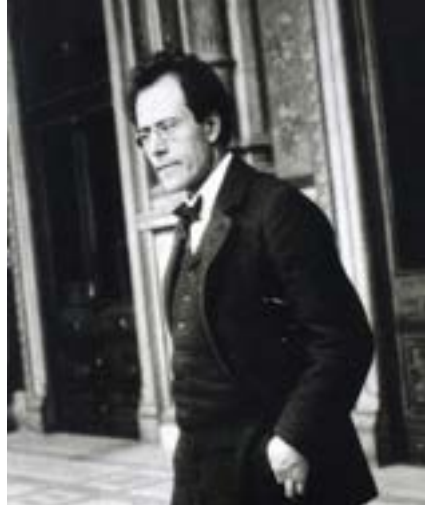
Gustav Mahler im Jahr der Komposition zu seiner 6. Sinfonie, 1903 in Wien

PHILHARMONIE SÜDWESTFALEN PHILHARMONISCHES ORCHESTER GIEßEN